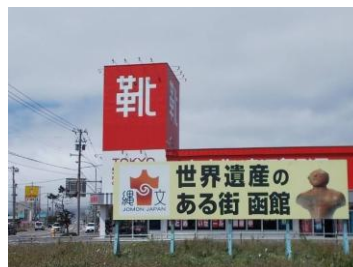
広野町交差点ロードサイン