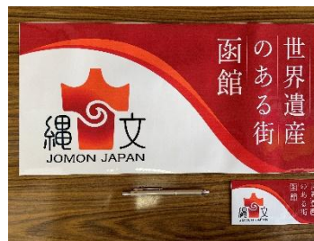
ステッカー大・小版