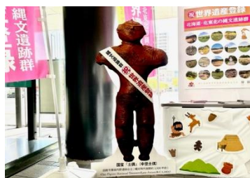
函館駅かっくうパネル用タスキ