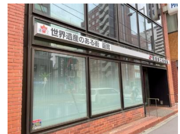
商工会議所横断幕