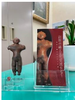
パンフレットスタンド