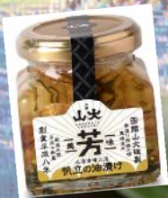
帆立の油漬け 40g 1090円(税込)

森町のみよい農園の有機かぼちゃと自社製造の低温殺菌ノンホモ牛乳を使用。クリームチーズクリームを乗せたケーキの様なぶりん。 株式会社 駒ヶ岳牛乳(01374-2-0808)