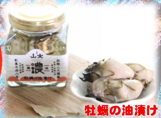
牡蠣の油漬け 50g 1260円(税込)

牡蠣の濃厚な旨味が詰まった一品。がごめ昆布の細切りを加えた醤油ベースの味付け。絶妙な火加減で身をふつくと仕上げています。 株式会社 山大(0138-48-0231)