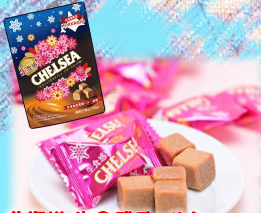
北海道 生食感チエルシー バタースカッチ味 (90g) 864円(税込)

北海道産発酵バターと北海道産生クリームを使用し、北海道でつくった生食感のチエルシー。北海道だけで出会える特別な美味しさ。 道南食品株式会社(0138-51-7187)