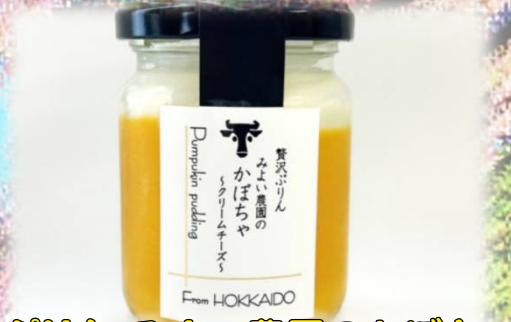
贊沢ぶりん みよい農園のかぼちゃ ～クリームチーズ～ 100g 500円(税込)

森町のみよい農園の有機かぼちゃと自社製造の低温殺菌ノンホモ牛乳を使用。クリームチーズクリームを乗せたケーキの様なぶりん。 株式会社 駒ヶ岳牛乳(01374-2-0808)