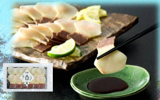
無着色ミンク鯨敵須ベーコン 白 60g 1940円(税込)

牡蠣の濃厚な旨味が詰まった一品。がごめ昆布の細切りを加えた醤油ベースの味付け。絶妙な火加減で身をふつくと仕上げています。 株式会社 山大(0138-48-0231)