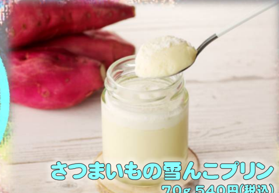
さつまいもの雪んこプリン 70g 540円(税込)

北海道厚沢部町産のさつまいもを使用。サツマイモの風味がしっかり味わえる、なめらかで濃厚なプリンに仕上がりました。 カドワフーズ株式会社(0138-62-6077)