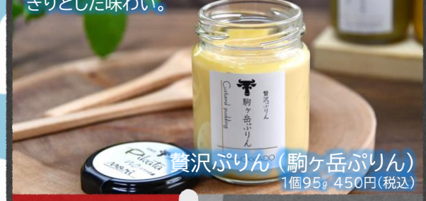
賈沢ぷりん®(駒ヶ岳ぷりん) 1個95g 450円(税込)

自社製造の『低温殺菌ノンホモ牛乳』とマダガスカル産バニラビーンズが香る至福のぷりん。濃厚ですっきりとした味わい。