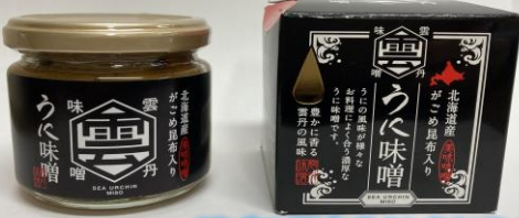
がごめ昆布入りうにみそ 150g 1458円(税込)

うにとがごめ昆布の風味を生かした、おいしい「うに味噌」です。ごはんのにせたり、みそ汁の味付けなどに。