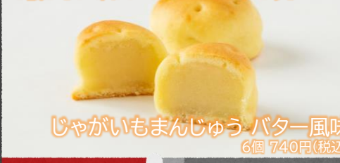
じゃがいもまんじゅう-バター風味 6個 740円(税込)

厳選した北海道産のじゃがいもとバターを餡に練りこんでじゃがいもの形にした、芳醇で懐かしい味わいのおまんじゅうです。