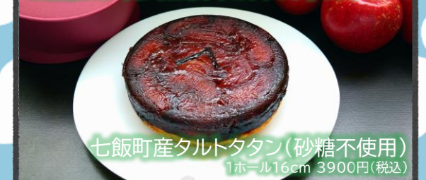
七飯町産タルトタタン(砂糖不使用) 1ホール16cm 3900円(税込)

七飯町産のりんごのみを使用。オーブンで長時間じっくり丁寧に焼き上げました。りんご本来の旨味を凝縮した「今までにないタルトタタン」です。