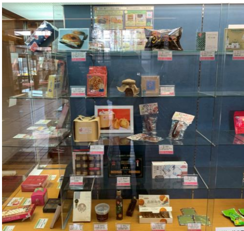
▲入賞品展示(函館市役所)