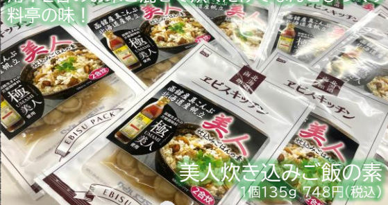
美人炊き込みご飯の素 1個135g 748円(税込)

函館生まれの万能調味料「極UMAMI美人」を使用！2合のお米と混ぜて炊くだけでなんとひっくり料亭の味！