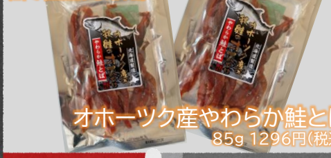
オホーツク産やわらか鮭とば 85g 1296円(税込)

北海道オホーツク産秋鮭のオスのみを使用。柔らかく旨味を凝縮させるため、独自の製法で仕上げました。