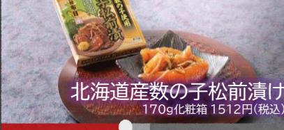
北海道産数の子松前漬け 170g化粧箱 1512円(税込)

しっかりとした食感の数の子を使用し、旨味・味わい深いスルメ・昆布を合わせた一品。ご飯のお供に！酒の肴に！