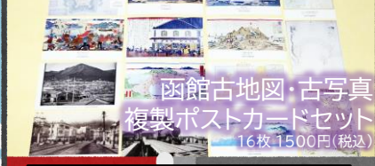
函館古地図・古写真 複製ポストカードセット 16枚 1500円(税込)

幕末・明治・大正・昭和時代の歴史資料(所蔵元:函館市中央図書館・市立函館博物館)を複製したポストカード16枚セット。