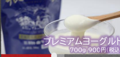
プレミアムヨーグルト 700g 900円(税込)

新鮮で濃厚な生乳と北海道産の芳醇な蜂蜜を使用。独自の製法で酸味が少なく、深いコクともっちりとしたヨーグルト。