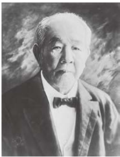
渋沢 栄一 (1840~1931)

この度、新紙幣の顔の一人となった渋沢栄一の生い立ちや心に刻みたい名言をご紹介します。