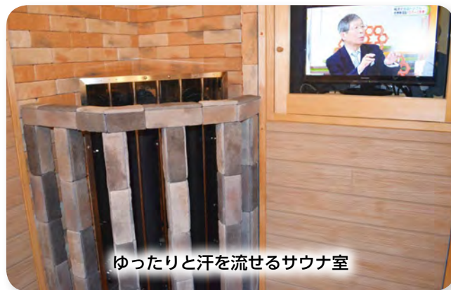
ゆったりと汗を流せるサウナ室

営業を再開して一番驚いたことが、予想したよりも小学生の利用が多いことです。友達と2～3人で訪れ、湯船に浸かり楽しそうにおしゃべりをしている姿を見ていると、昔ながらの風景が再現されたことに喜びを感じます。昔の子供と比べ、今の子供は外遊びが少なくなった、コミュニケーションを取る遊びをしなくなった等の声を聞くことがありますが、当店で訪れる子供たちを見ていると、そういった交流やふれあいの場を一番求めているのは、子供達なんじゃないかなと思います。