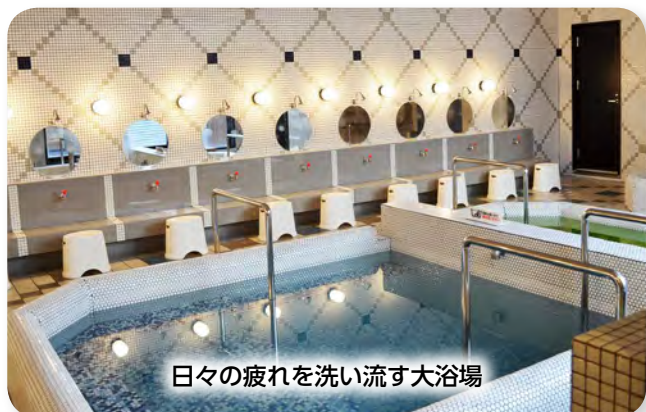
日々の疲れを洗い流す大浴場

長年、田家町を中心に地域のお客様に親しまれてきた「田家湯」ですが、平成19年に火災に見舞われ、閉店を余儀なくされました。利用客の減少や当時燃料に使っていた重油価格の高騰等の理由から再建を断念していましたが、再開を望む地域の皆様の声が多かったことはもち