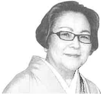
函館商工会議所女性会 会長