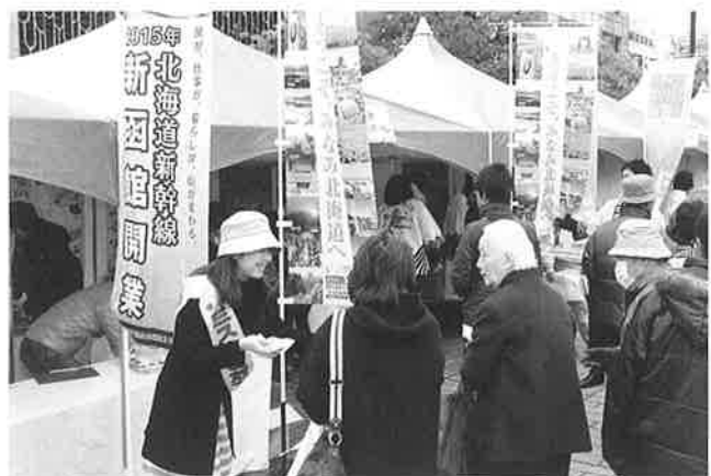
▲2万5千人が来場し、賑わいを見せるイベント会場

会期中は雨など天候に恵まれなかったものの、2日間で2万5千人が来場し賑わいました。北海道新幹線新函館開業時には、現在約4時間を要する函館—仙台間が約2時間半程度にまで短縮され、みなみ北海道地域と東北地域との観光・経済・文化交流がより一層加速していくものと思われることから、引き続き開業に向けて東北地域へのPRを実施していくこととしています。