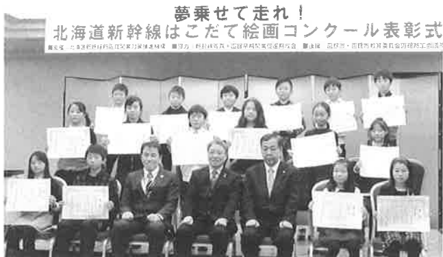
▲16名の絵画コンクール入賞者

なお、入選作品を含む全作品については、4/13～22まで棒二森屋5階連絡通路階段、5/21～27まで五稜郭タワーアトリウムで展示されます。