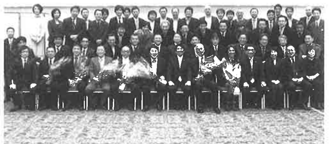
▲卒業生7名を囲んで