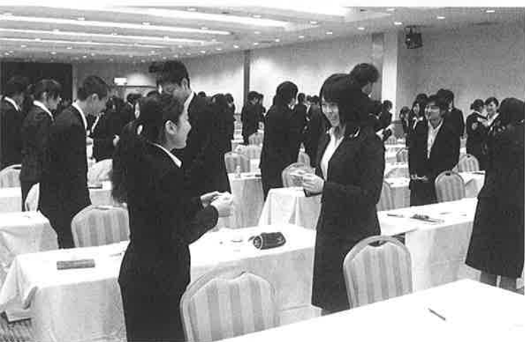
▲名刺交換のマナーを学ぶ参加者

本所ならびに函館地方法人会主催の平成24年度新入社員セミナーを去る3月22日、今春入社予定者を中心に132名が参加のもと、ホテル函館ロイヤ