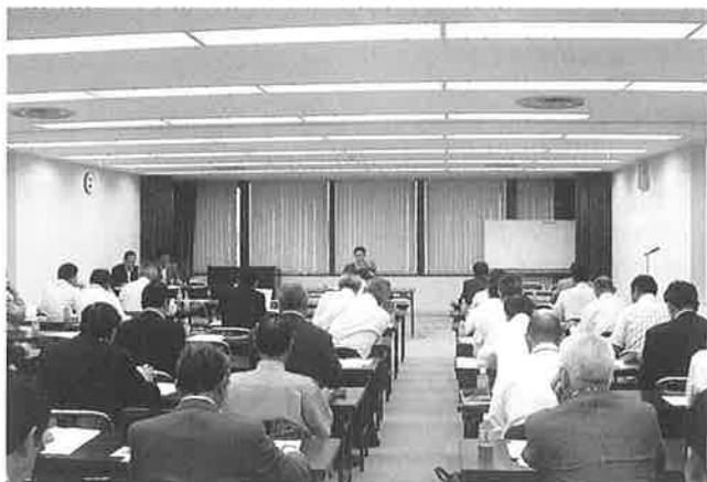
▲函館アリーナ整備基本計画について説明を受ける参加者

ン施設の確保は、本市にとって大きな課題である ことから去る8月24日には、7部会の合同正副部 会長会議を開催し再度意見交換を行い、本所とし ての意見とりまとめに向けて協議を行いました。