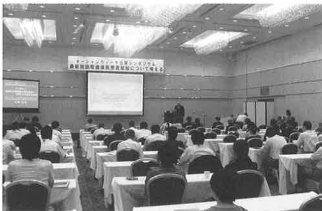
▲多くの参加者を集めた公開シンポジウム

診療、国外における国際医療貢献をより図るため には、病院船は重要な役割を担い、また、候補地の 1つである函館が拠点港に決まれば、経済効果に期 待がもてると述べられました。