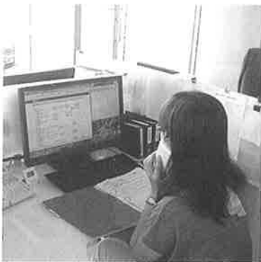
▲親切・丁寧に対応します。