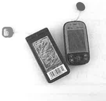
▲簡単操作で緊急通報

新規立ち上げ事業所として、一人でも多くの方に知っていただき、ご利用者様に安心・安全に在宅生活を送っていただけるよう、支援したいと考えております。要望があれば何度でもお伺いさせていただき、ご説明させていただきますので、お気軽にご連絡ください。