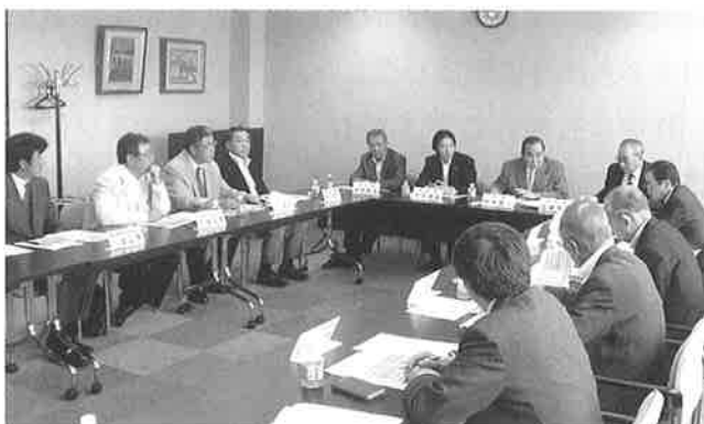
▲新函館開業と青函連携について協議を行う参加者

取り組んでほしいとの発言があり、会議では、今後新函館開業までに想定される進捗スケジュールを確認し、開業対策を有効に行うため今秋に合同で青森地域先進地視察を行うことで合意しました。