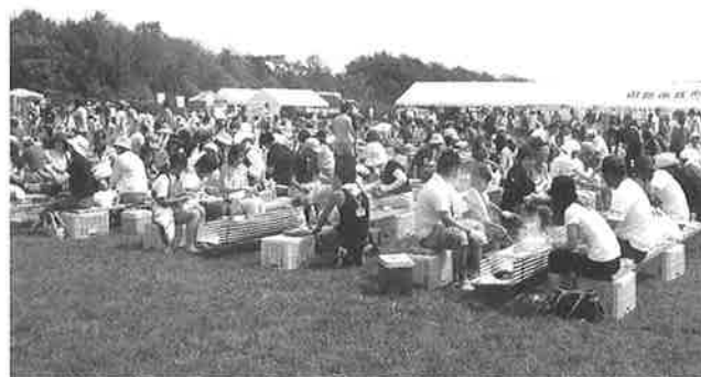
▲多くの来場者で賑わう会場