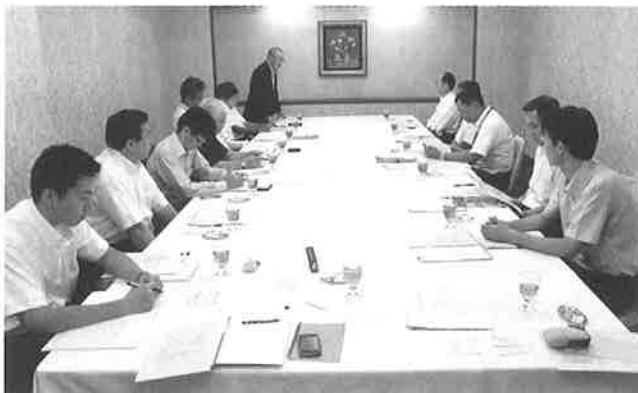
▲新幹線開業地域から現況を聞く視察団

当視察会は、3月に実施した正副委員長会議において「困難な問題が多い新幹線開業対策を展開する上で先行開業地域から実例を学ぶ」という方針に基づき開催したもので、10名の視察団は新幹線の新青森開業によってJR並行在来線の経営分離区間を引き継いだ青い森鉄道の関係者、ならびに経営分離後の地域への影響が大きい三沢市の市役所を訪問、現況や今後の見通しについてヒアリングを行いました。