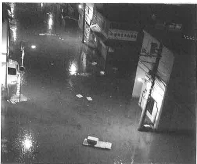
▲本所3階屋上より撮影

津波の影響で多くの店舗が浸水し、商品や冷蔵庫などに大きな被害が出た函館朝市では、店舗の浸水状況の説明を受け、復旧作業に当たる関係者をねぎらい、卸売市場では、施設の津波被害や同日朝に再開した競りの状況の報告を受け、高橋知事は、市や経済界と連携して復旧・復興に向けて生活環境を整備し、財政的な支援をしていきたいと述べました。