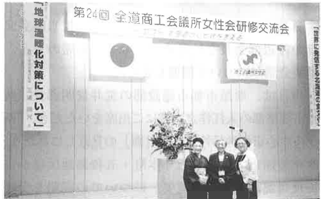
▲研修交流会に参加した女性会メンバー