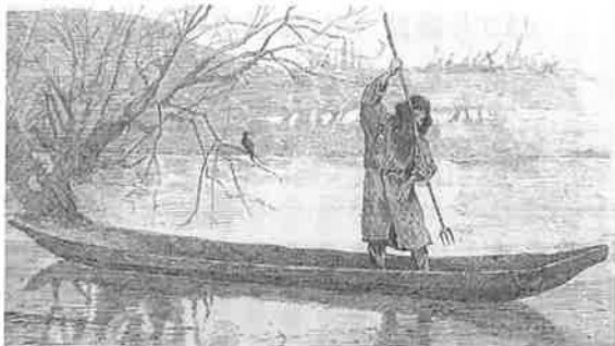
▲漁労をするアイヌ

「この島が完全に日本人の領土となったのは、つい近年のことである。1868年の徳川幕府の瓦解までは、日本の本土との関係はかなり希薄であった。幕府は、蝦夷にあまり関心をもたず、その発展に努力することもなかった。現農商務大臣、榎本武揚は、1868年の戊辰戦争では幕府の艦隊司令長官をつとめ、艦隊を率い蝦夷に逃れ、箱館〔函館〕および福島を占拠し、共和国樹立を宣言した。だが、1869年6月末、幕府軍は耐乏生活と相次ぐ敗戦のため、新政府に降伏せざるを得なかった。共和国は崩壊したのである。1872年、蝦夷は最終的に日本領となり、北海道つまり“北海の道”という名称をあたえられ、9支庁に分割統治された。」