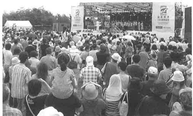
▲大勢の市民が詰めかけた「ドリームボックス150」の屋外ステージ

当イベントは、函館開港150周年を祝うとともに、今後の更なる発展を誓い、食・音楽・スポーツをキーワードに開催されました。期間中は、コンサートや体験型イベントなど約50の行事が繰り広げられ、連日多くの市民で会場は賑わいをみせ、盛会裡に終了しました。