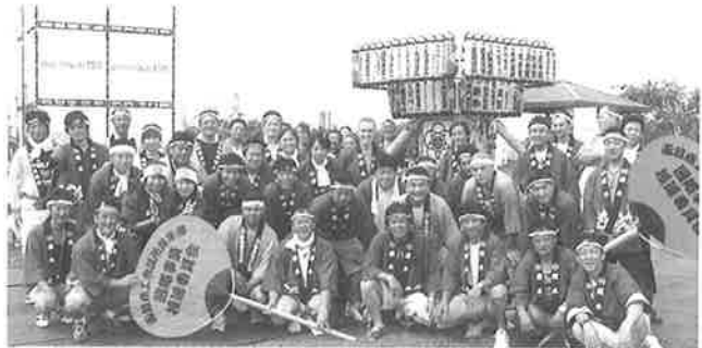
▲御輿を担いだ青年部メンバーと外国人の方々

また、夜には外国人の方々を交えて親睦会が行われ、昼間のスライドショーや表彰式を行い、終始笑顔のなか盛会裡に終了しました。