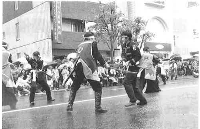
▲盛り上がりを見せる戦闘パフォーマンス