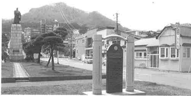
▲高田屋嘉兵衛像と日露交友の碑 (右手の一色医院のあたりがゴロウニンの幽囚された付近)

8月22日、松前に移されてからは、松前奉行の尋問が何度もくりかえされ、食事も極めて粗末であったと記されております。また、文化9年4月には脱走しましたが、今の上ノ国町で捕まえられ堅牢な牢屋に収容されております。