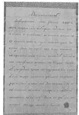
▲函館市中央図書館が所蔵する 伝ゴロウニンの書

2人の絆ともいえる高田屋嘉兵衛像と友好の碑は、開港より40年前の歴史を今に伝える上で、貴重なモニュメントとして、大きな役割を果たしているといつてよいでしょう。