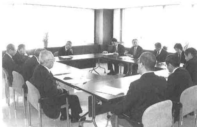
▲協議を行う委員会メンバー

本件については、2月9日開催された常議員会に附議され、全員異義なく承認決定されたことから、同ビルを取得し、4月上旬に移転することになりました。