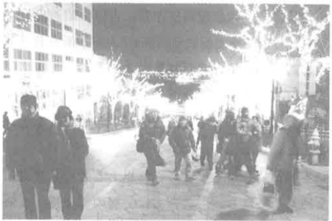
▲参加者で賑わう八幡坂

また、函館市民や観光客が共同で作製したワックスキャンドルを配置し、幻想的な街並みを演出する「はこだて『光の小径』」も同時に行われ、参加者を魅了しました。