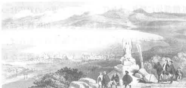
▲電信丘（函館山）より見た函館

函館の街並みの様子、商店が販売する品々そして函館山への登山など、遠征記からその一部を紹介したが、家屋のこと、寺院のことをはじめ数十ページにわたって実に事細かく函館の状況を観察して記述しております。