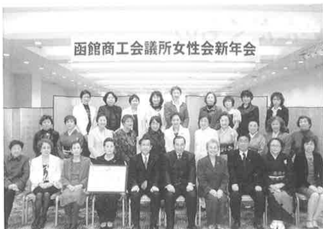
▲新年会を終えての集合写真