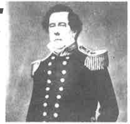
▲ペリー提督

今年平成21年は、函館が我が国最初の国際貿易港として、横浜・長崎とともに開港して150周年という記念すべき年であります。本所では、その時代函館を訪れた外国人が、この地をどのようにとらえていたのか、日記や紀行文、見聞録などの文献資料をもとに紹介してまいります。