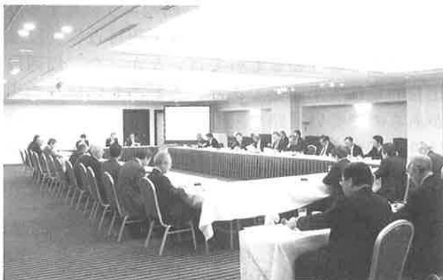
▲ロワジールホテル函館で行われた合同部会

また、当地大学との共同研究実績がある横浜の企業から新技術開発に関する報告があり終了しました。