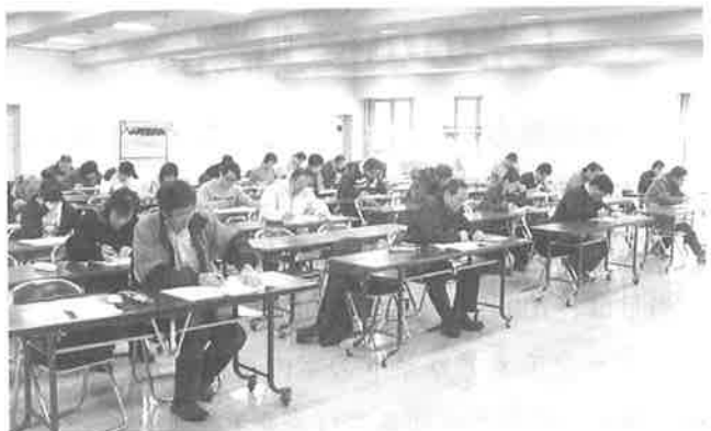
▲真剣な表情で試験に臨む受験者

なお、この認定試験は来年も開催を予定しておりますので皆様の挑戦をお待ちいたしております。