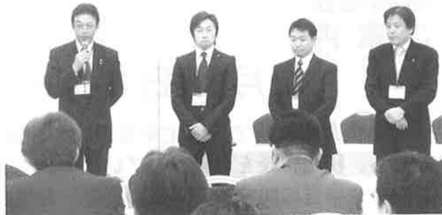
▲紹介される次期正副会長

る厄年の方による豆まきや、ゲーム大会が行われ、和やかな雰囲気のなか終了しました。