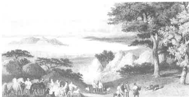
▲雪山より見た函館の景

『日本遠征記』は、日本が開国するにあたって折衝してきたアメリカ側の公式報告書であり、幕末日本の世相や風俗などがさし絵をまじえて記録されておりますが、150年前にアメリカ人がとらえた函館のあり様を知る上で興味深い一冊であります。