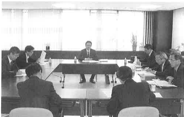
▲協議を行う委員会メンバー

また、20日には前回検討された内容をもとに、現地での訪問先や、視察内容、日程などについてより具体的に協議を行いました。