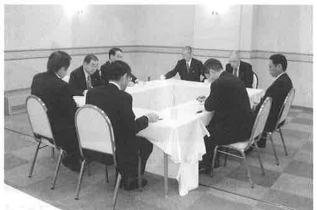
▲ホテルオークランドで開催された理財部会