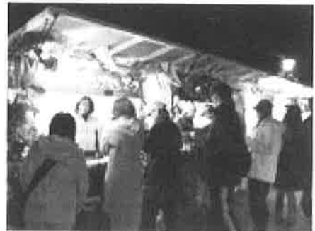
▲昨年のスーパースーパーの様子