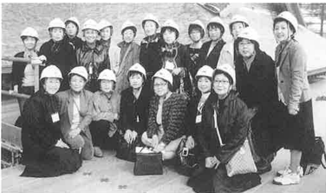
▲復元工事を行う函館奉行所を背景に