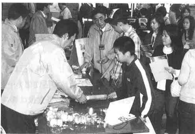
▲スタンプラリー-景品交換所