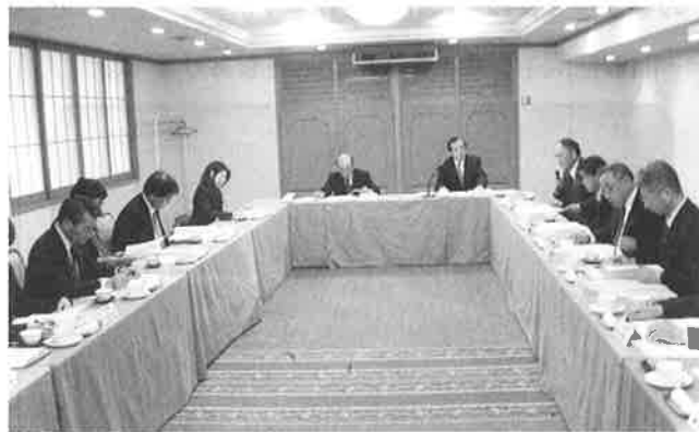
▲室蘭市で開催された道南商工会議所連絡協議会

また、平成21年に開催される第59回全道商工会議所大会の開催予定地が道南ブロックとなっていることか