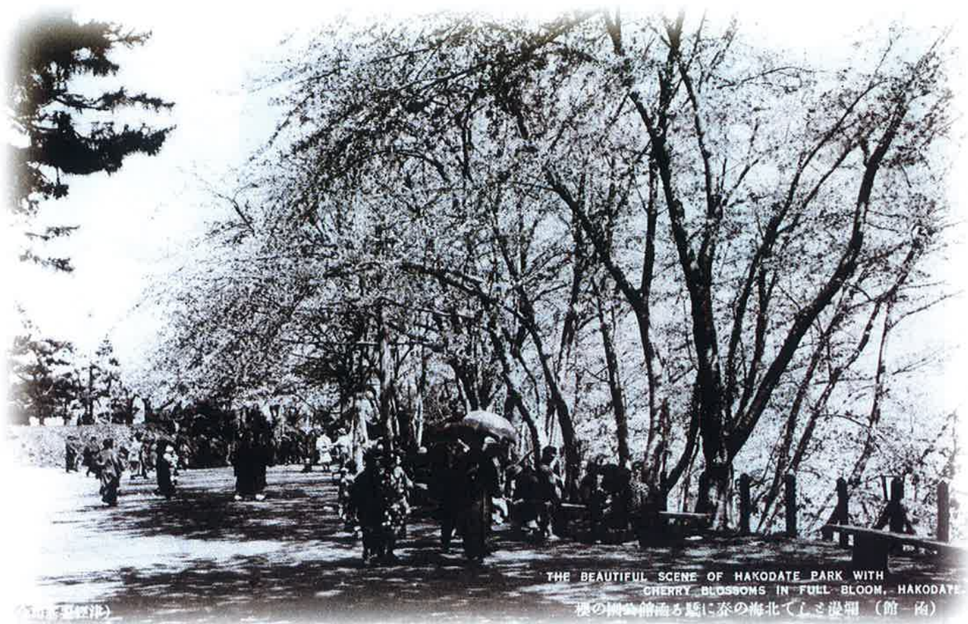
THE BEAUTIFUL SCENE OF HAKODATE PARK WITH CHERRY BLOSSOMS IN FULL BLOOM. HAKODATE 櫻の樹並館画る庭に春の海北てしと漫冊 (館一函)