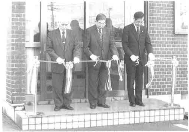
▲去る4月2日、開所式としてテープカットが行われた