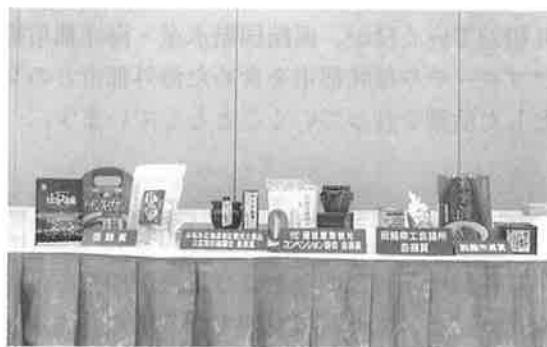
▲第51回優良土産品受賞商品

当日は、農水産、菓子の各部門に、道南の企業18社から、新製品、自信作など68点の出品がありました。推奨会では、まず第一次審査として、過大包装、不当表示、表示義務などを厳正に審査し、その結果、合格品として認められた商品が「函館圏優良土産品」として認定されました。