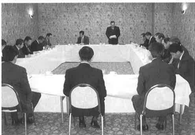
▲11名の委員による統合協議会

これを受け、銭亀沢商工会は理事会、会員説明会を既に開催しており、今後は1月21日の銭亀沢商工会臨時総会において審議がなされ、平成19年度早期の本所との統合について機関決定することを目指すこととなりました。