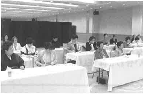
▲平成18年度女性会総会