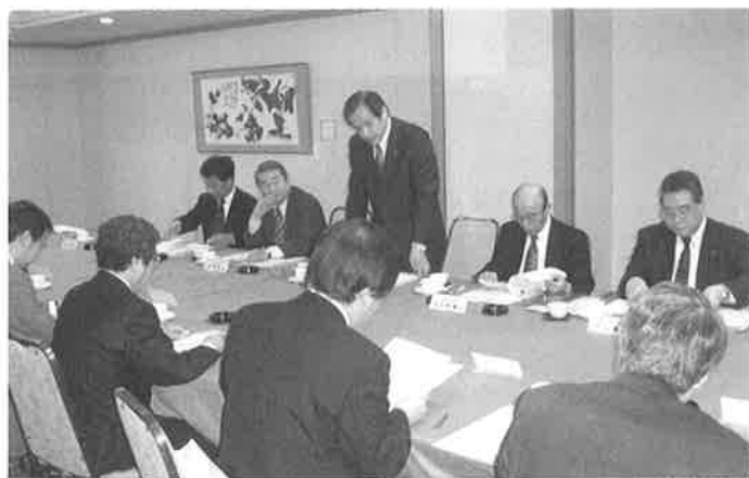
▲道南商工会議所連絡協議会

道南商工会議所連絡協議会 (函館・森・伊達・室蘭・登別・苫小牧・浦河の7商工会議所で構成) 専務理事・事務局長会議が、去る4月25日に室蘭市で開催されました。