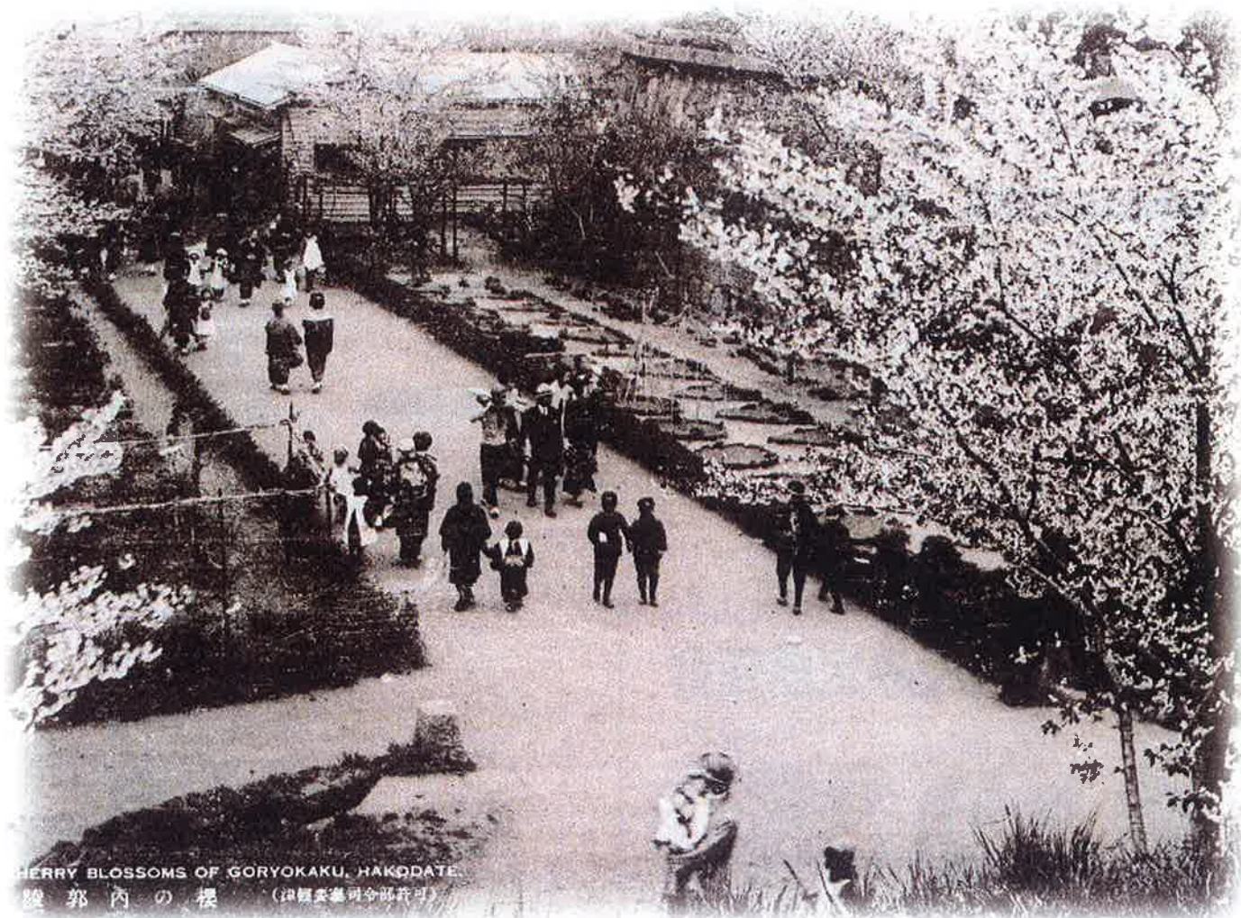
CHERRY BLOSSOMS OF GORYOKAKU, HAKODATE.