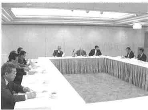
▲平成18年度観光土産品定時総会

本所に事務局を置く、みなみ北海道地区観光土産品公正取引協議会の平成18年度定時総会が去る4月28日、函館ハーバービューホテルにおいて開催されました。