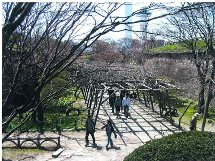
陸 郭 内 の 桜 (海軍要塞司令部前)