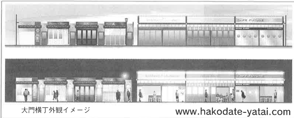
大門横丁外観イメージ