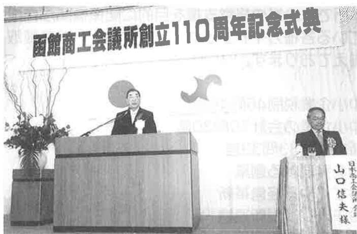
▲主催者挨拶を行う高野会頭