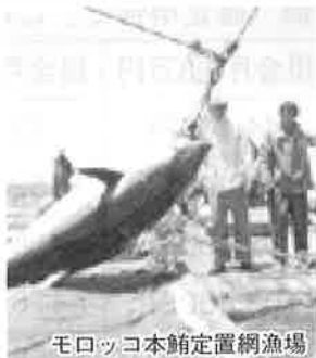
モロッコ本館定置網漁場