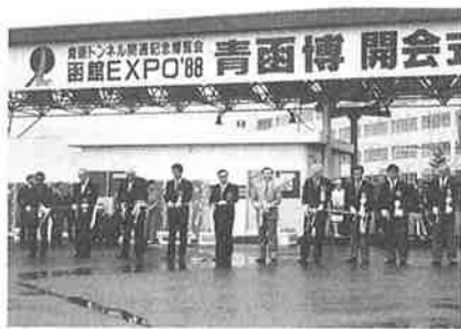
▲青函トンネル開通記念を祝い開催された青函博覧会