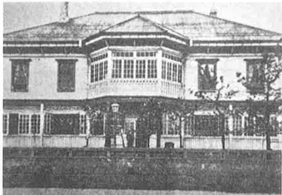
会議所最初の事務所（函館町会内）