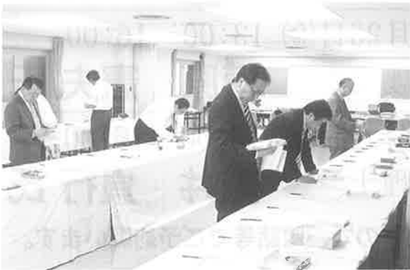
▲50点の商品をチェックする審査員

事項や不当表示の禁止などに関し、消費者に誤解を与える可能性のある表示などの改善事項が指摘されたことから、この指摘を受けた「条件付き合格品」について今後、製造元等に事務局から改善指導を行うこととしています。