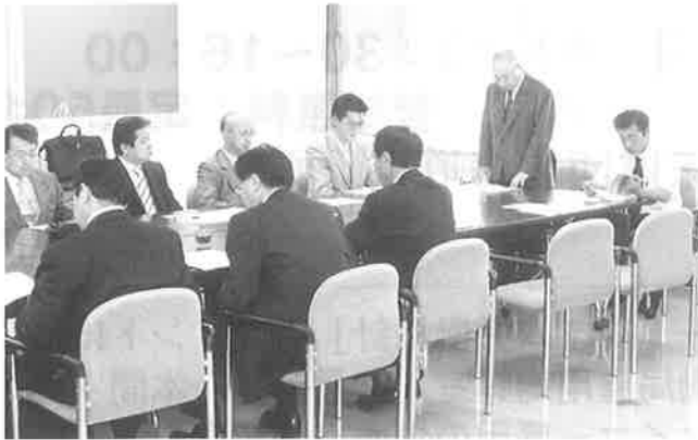
▲第34回観光土産品試買検査会

本所に事務局を置くみなみ北海道地区観光土産品公正取引協議会「第34回観光土産品試買検査会」が去る7月15日、本所会議室において開催されました。