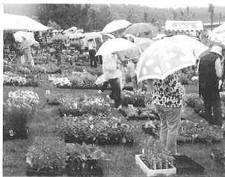
▲小雨の中、花々を楽しむ来場者

て「夢の国からの贈り物」に沿った色鮮やかな花々が飾られたなかで、ガーデンングコンテストや公開フラワーアレンジメント等が行われました。その中でも、当イベントのメインでもある園芸オークションには、多くの人々が参加し大いに楽しんでいました。