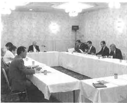
▲マルチメディア推進協議会総会

函館マルチメディア推進協議会(本所事務局)の定期総会が、去る6月23日開催され、