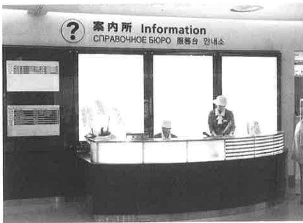
▲1階到着ロビーに設けられた案内所