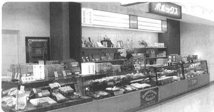
▲品揃え豊富な2階売店

また、一般の方々にご利用いただくことができる、絵画等の展示コーナー「空港ギャラリー」も併設しています。