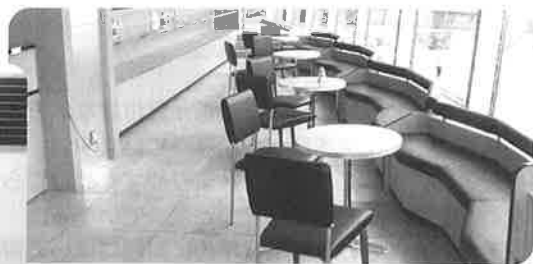
▲景色を眺めながら軽食を楽しめる 2階搭乗者待合室内飲食店