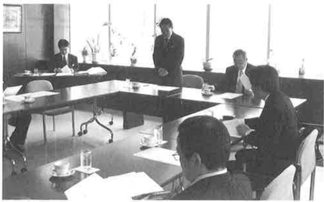
▲去る6月14日に開催された国際委員会