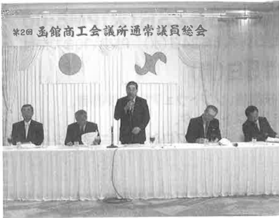
▲第2回通常議員総会