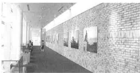
▲2階空港ギャラリー