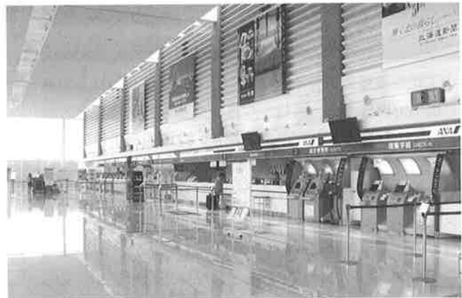
▲広々としたチケットロビー