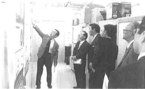
▲北大マリンフロンティア研究施設を視察する委員会メンバー

各機関とも地域企業のニーズに応える場として積極的に取り組んでおり、函館発の技術・製品の研究が行われています。