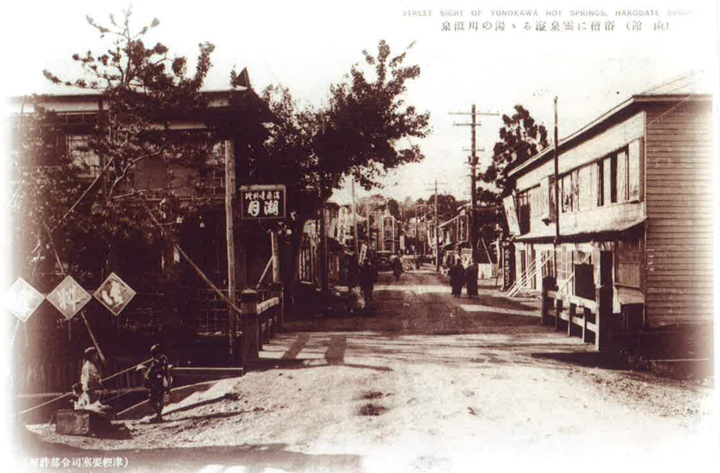
(町許部令司案要標津)

STREET SIGHT OF YUNOKAWA HOT SPRINGS, HAKODATE 1900s 泉温川の湯、る湯泉雲に積浴(館 向)