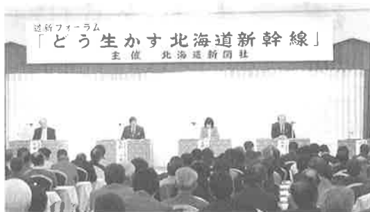
▲去る5月16日に開催された道新フォーラム

今後は、開業へ向けての建設工事が進められていきますが、一日も早い開業を目指しての陳情・要望活動等も繰り広げていくこととしています。