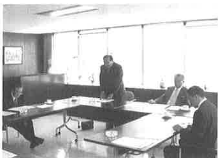
▲広域連携正副委員長会議

同委員会は、商工会との連携を深めつつ合併問題に向けた調査研究を進めることを目的としており、当日の会合では、今後の委員会運営について協議がなされ、1会議所6商工会となった現況とこれまでの話し合いの経過を踏まえ、今後は自治体の動きにも注目しながら具体的な活動方針を決めていくこととしています。