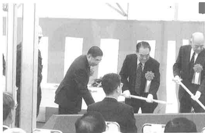
▲多くの関係者が参加した起工式

昨年12月に、市民のみならず北海道民の長年の悲願でもあった北海道新幹線（新青森～新函館間）の着工が決定し、それを受け、北海道新幹線新青森・新函館間建設工事起工式並びに新幹線着工祝賀会が去る5月22日、渡島大野駅前