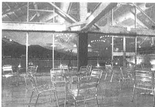
▲景色を眺めながら食事を楽しむフードテラス

・お問い合わせ先 クイーンズポートはこだて 函館市若松町12-13 23-5577 ・営業時間 午前8:00〜午後10:00 ミュージアム 摩周丸 大人 1,000円 500円 中学生 600円 250円 小学生 400円 250円 函館駅周辺ではこのほかにも、今年7月オープン予定で、ホテルルートイングランティア函館駅前が工事を行っており、また、(株)はこだてティーエムオープンデュースによる「大門横丁(ひかりの屋台)」が11月オープンを目指して作業が進められています。