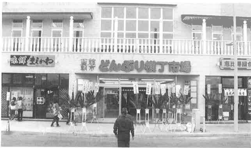
▲4月25日にオープンした函館朝市どんぶり横丁市場