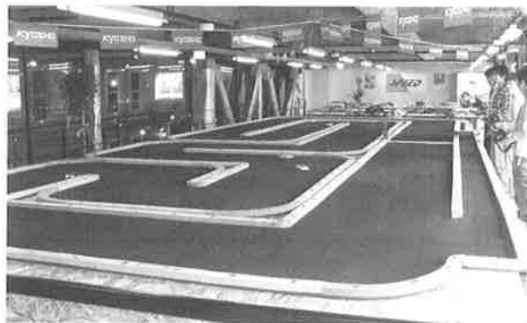
▲ラジコンレースを楽しむサーキット場