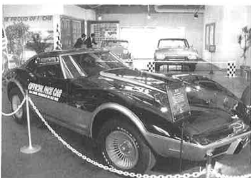
▲今現在も人気のスポーツカー