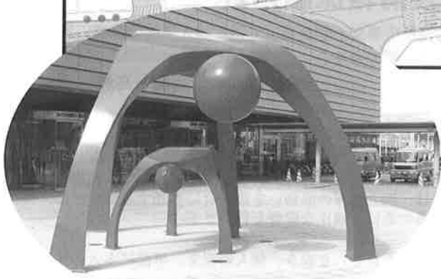
▲パブリックアート「OYAKO」