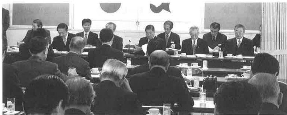
▲本所、第一回通常議員総会