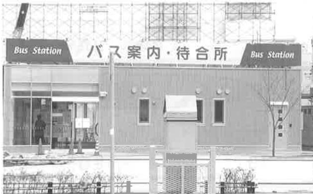
▲バス案内所・待合所