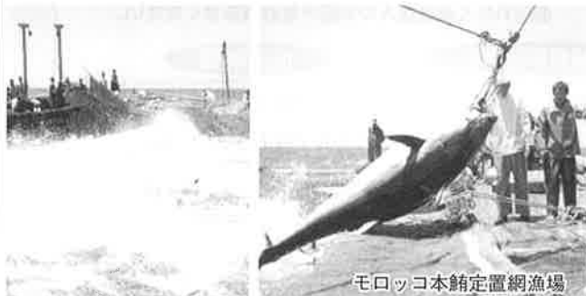
モロッコ本館定置網漁場