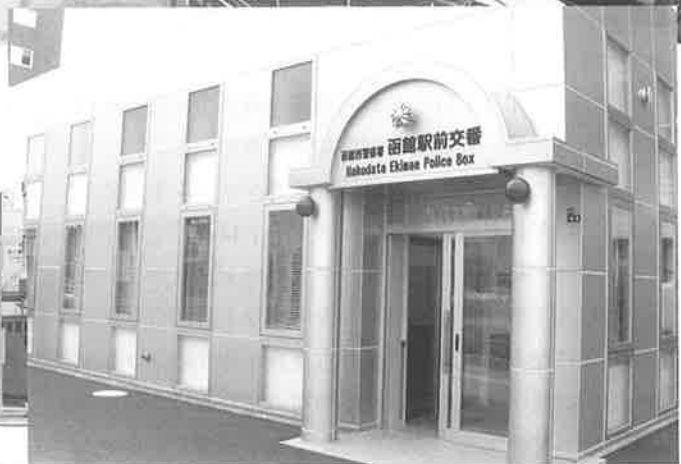
▲新しく建設された駅前交番