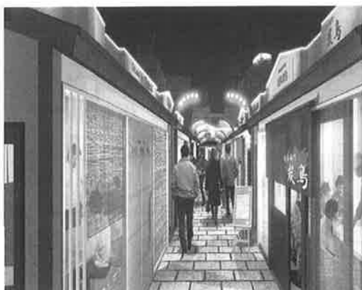
かたらい小路(Aタイプ)▼

イメージ店舗：天麩羅、家庭料理 ラーメン、焼肉、焼鳥 ジンギスカン、おでん イカ刺の店、汁料理 焼き魚と煮魚の店 餃子の店 等