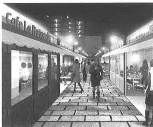
ハイカラ通り(Bタイプ)▼

イメージ店舗：イタリアン、洋食の店 点心・飲茶、無国籍料理、 ワインの店、和食 ビールとソーセージの店 カフェ 等