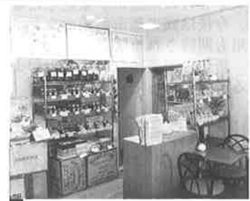
紅茶専門店ルフナ

詳しくは当店ホームページでどうぞ http://www.tea-harvest.com/ruhuna