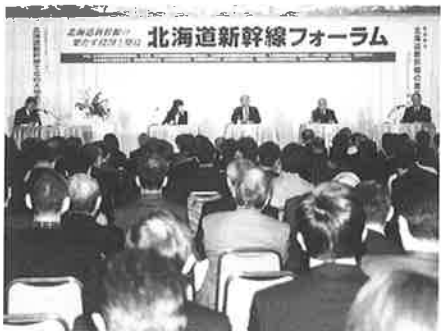
▼2月15日（札幌市）開催された新幹線フォーラム

されており、今こそ青函同時開業に向けた地域全体の共通の意識と、一丸となった運動を展開していかなければなりません。