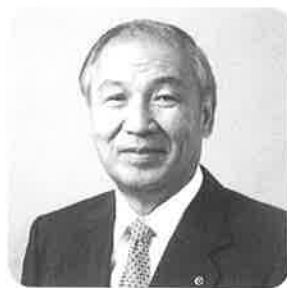
日本商工会議所 会頭 山口 信夫