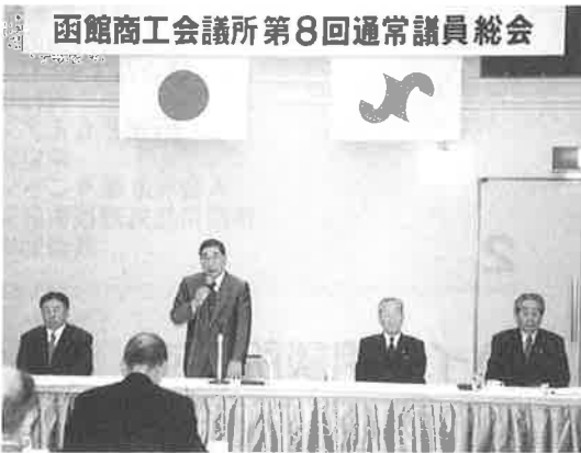
函館商工会議所第8回通常議員総会

特記すべき主な事項として、総合交通ネットワークの整備促進、サハリンとの経済交流促進強化、台湾チャーター便誘致訪問団、中小企業融資円滑化に向けた取り組み、「はこだて・みらい・産業展」の開催、中心市街地活性化への取り組み、起業化・経営革新支援の取り組み、短時間労働者雇用管理改善等事業の取り組み、地域情報化推進への取り組み、相談指導体制の充実強化、青森・鹿児島商工会議所との交流の推進等、各事業について説明が行われました。◎平成十二年度収支決算 収入の部では、三億三千五百九十七万一千五百五十一円となり、支出の部では、三億一千八百三十八万七千八百七十九円で、次年度繰越金は一千七百五十八万三千六百七十二円となった旨の説明が行われました。