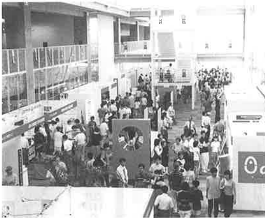
出展ブースはどこも大盛況