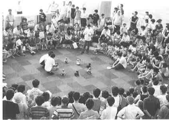
人々を楽しませた各種イベント。 ロボット犬AIBOのパフォー マンスに子供達の歓声上がる