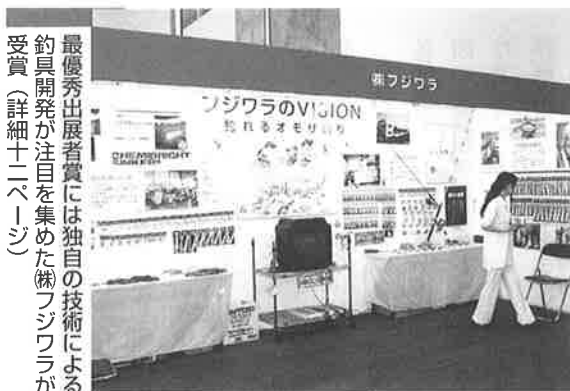
最優秀出展者賞には独自の技術による 釣具開発が注目を集めた(株)フジワラが 受賞(詳細十二ページ)