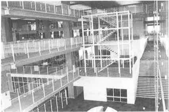
▼会場の未来大学構内

「はこだて・みらい・産業展」は、当地域の企業・団体・研究機関の製品・技術・情報のノウハウを一堂に会し、産・学・官の交流の場、二十一世紀の産業シーズ・ニーズを考える場として創出し、地域中小企業の育成・振興を図ることを狙いとしています。