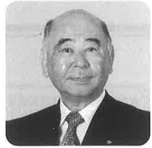
日本商工会議所 会頭 稲葉 興作