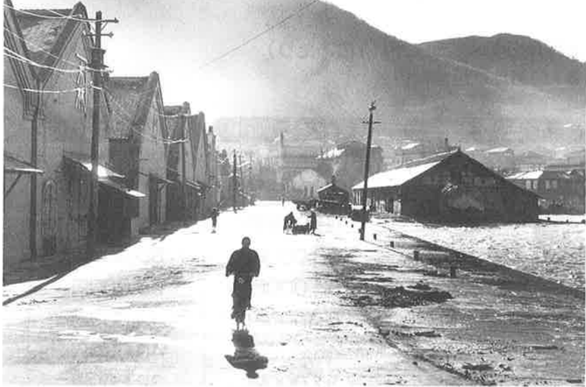
(撮影 井上 清 1954年)