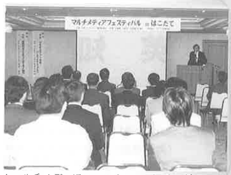
▲マルチメディアフェスティバルinはこだて