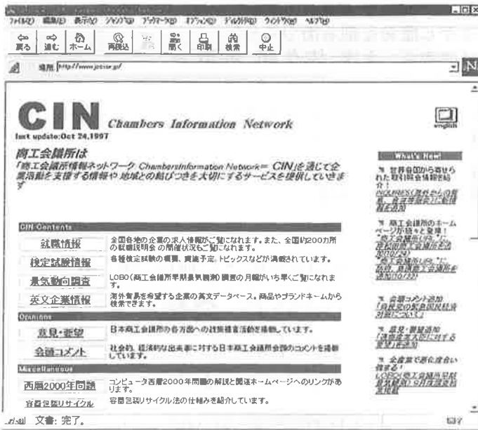
▲CIN構想を進める日本商工会議所のホームページ ( http://www.jcci.or.jp )

特にインターネットに代表される情報ネットワーク分野ではマルチメディア技術が加速度的に進化し続けており、同協議会では今後共啓蒙・研究活動を続けて行く予定となっています。こうした流れの中で現在本所では地域の情報発信を目的としたホームページの作成を行っています。また全国の商工会議所でも活動基盤強化の為に情報ネットワーク化推進に取り組んでおり、今回はそれら概要についてご紹介します。