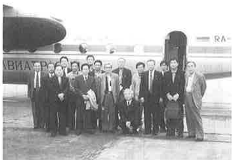
▲アエロフロート機の前で訪問団一行

また、石油開発に伴う企業参入については、現地インフラ、法体系等のリスク面がネックになると思われますが、韓国や道内他地域からの働きかけも活発になってきており、今後とも積極的な交流による情報収集・分析が重要になると思われます。