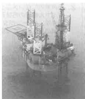
▲海上プラットフォーム

この後同社技術者の案内で、現在試掘が進行中であるサハリンIの海上プラットフォーム二カ所と陸