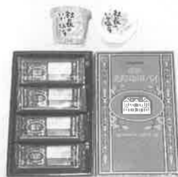
▶市長賞受賞の 二品

本格的な観光シーズンを前に、道南地域を代表する優れた観光土産品を発掘、育成すると共に、当地域を訪れる観光客に、より良い安心の持てる商品を提供するため、去る三月二十六日に第四十一回函館圏優良土産品推奨会が本所において開催されました。