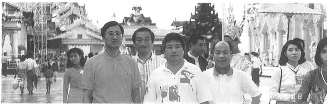
パゴダ(寺)の広い境内で。男女ともロンジー(腰巻き)を身につけ素足で歩く

一日目、まだ残雪の函館から関西国際空港経由、夜のバングラコクに到着。気温三十度、気温の変化に驚く間もなくバスにてホテルへ直行、明日からのミャンマー行きに備えバングラコクの夜を眠りにまかせた。