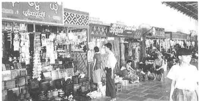
寺院内の店は浅草の仲見世的な印象(スーレパゴダ)

現地に向かう前のミャンマー国内情勢についてのレクチャーによれば、国内は衛生事情が悪いため、マラリア等の病気が発生する可能性があるとのこと。最近では従来の特効薬も効かないタイプのマラリアもあるという。そのため蚊に刺されないよう工夫することや、アメーバによる大腸炎や赤痢、経口感染するA型肝炎、E型肝炎等の予防のため水や食料は必ず加熱してから食べることに注意がされた。そのため参加者は全員ミネラルウォーターを二本持つての出発となった。ホテルについてもヤンゴン以外の都市には国際レベルのホテルは少なく、部屋にもバスタブのついていないタイプが殆どで、シャワーもお湯が出ないところが多いとのこと。航空事情も、スケジュールの変更、運休、遅延や、便数が限られていることによ