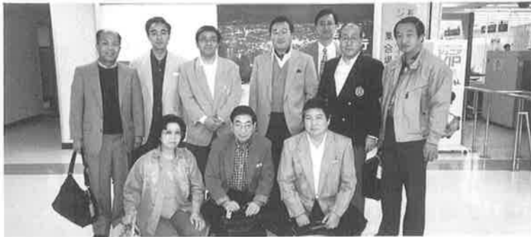
函館空港にて、海外視察団の一行