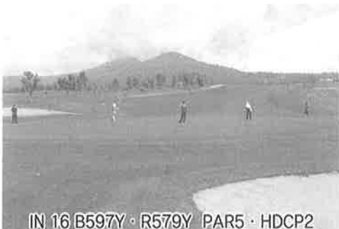
IN 16 B597Y・R579Y PAR5・HDPC2

KG名物のマンモスグリーン。一見単調だが予想以上にタフなホール。的確な3オンを狙う。セカンドは左OBに注意。