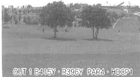
OUT 1 B415Y・R396Y PAR4・HDPC1

HDPC1の長いミドルホール。真中の長い白樺まで300ヤードを越す。ティーショットはやや右目落とすとセカンドが狙いやすい。