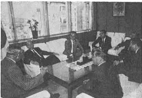
大倉総裁(左2人目)と懇談する社会頭(左)ほか

中心に当面の経済概況について説明しましたが、総裁は経歴が示す通りその道の権威者であるだけに、全国的視野での経済情勢と地方都市の実勢とのズレや、当市の地域特性に深い理解を示されました。