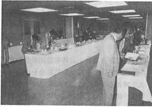
過大包装はないか……厳しくチェックする審査員たち

本格的な観光シーズンを迎え、不良土産品を一掃しようと恒例の試買検査会が六月三十日本所で開催されました。今年は、函館駅前商店街、朝市、五稜郭公園、湯川温泉街、函館空港の五地区から四十点の観光土産品を無差別に試買したものです。審査は公正取引委員会、消費者協会、保健所の代表等八人の審査員が、過大包装、不当表示等にポイント