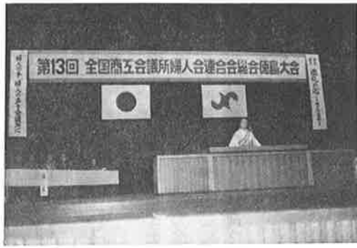
開催地徳島婦人会長のあいさつ

今大会の協議事項は(1)中小企業事業承継税制の創設に関する要望について(2)行政改革の推進について(3)小さな親切運動の推進について(4)総会