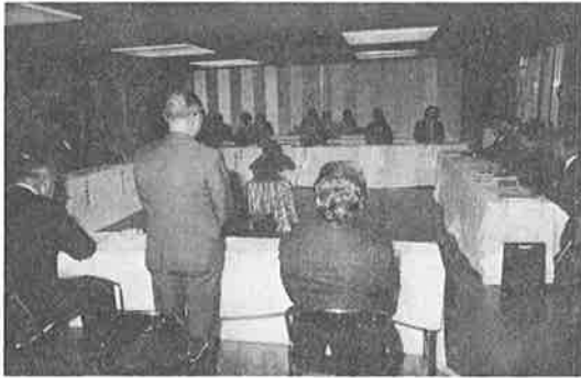
挨拶をする三本木座長 (道青連会長)

この座談会は、毎年国税庁が行う「税を知る週間(毎年十一月十一日から十七日まで)」の一環として開かれるもので、当日は、関係機関か