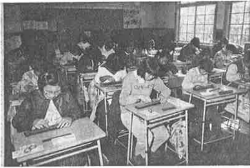
真剣に検定試験に取り組む受験者たち