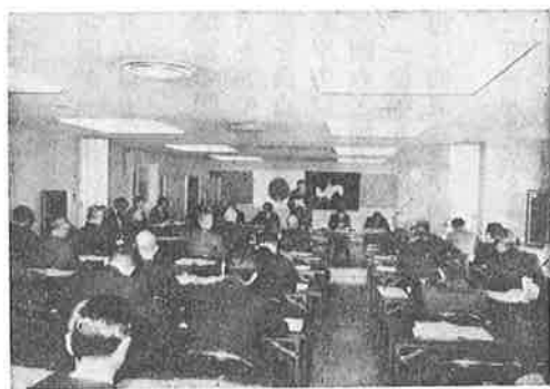
第3回通常議員総会で挨拶する社会頭