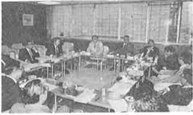
提案事項を練る連絡協

近年の本州大型小売商業の進出は地域中小業者にとってその対応にいとまがない程混迷の事態を生じているところから、大型店出店に係わる商業秩序維持に